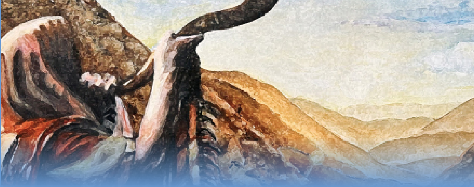
Table of Contents 目錄

03 欄目一：聖經世界觀 / Column 1: Biblical Worldview 聖經世界觀 I - 心意更新：第七課 罪和苦難：性善或是性惡